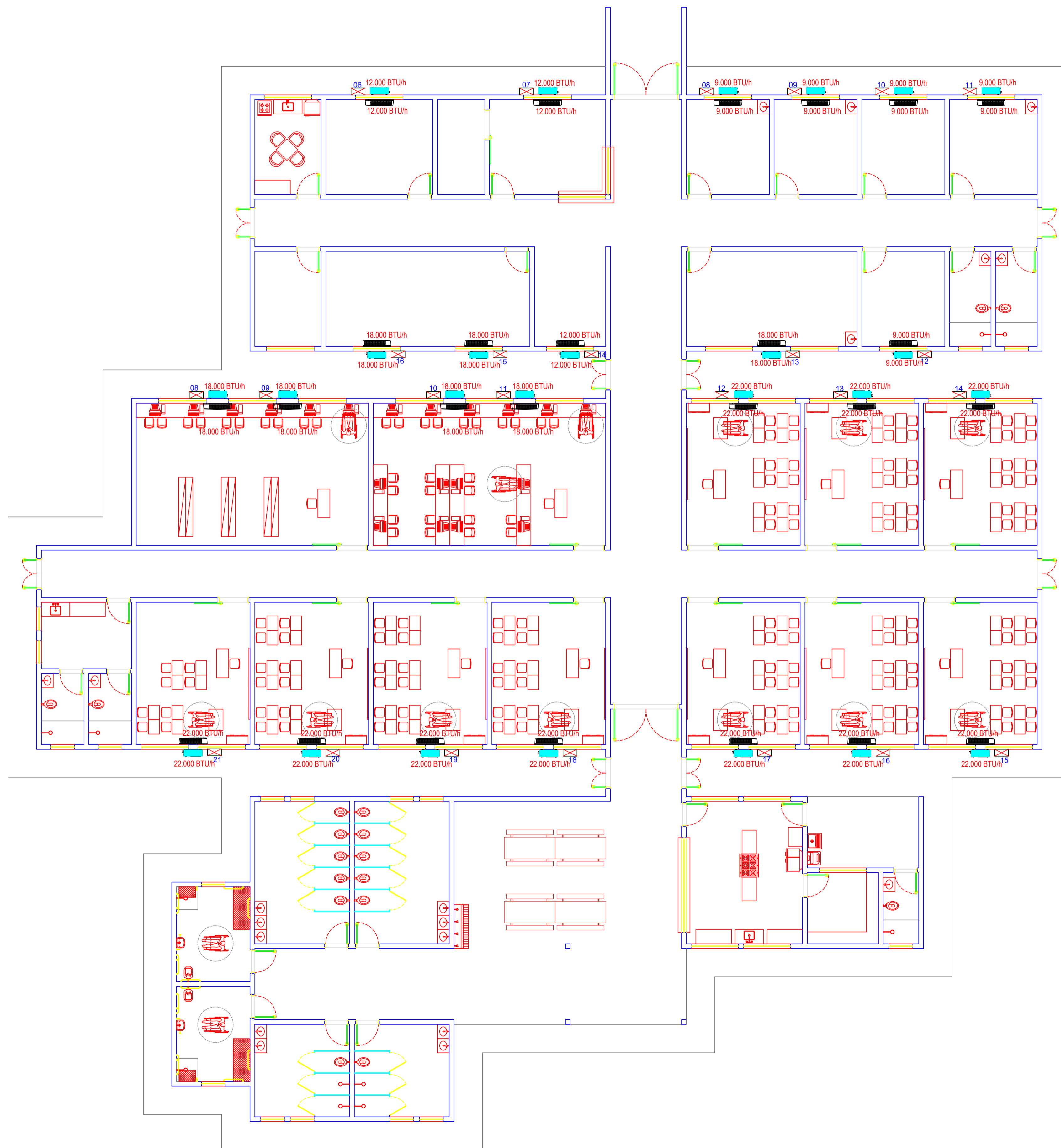
PLANTA CLIMATIZAÇÃO - TÉRREO esc 1:100