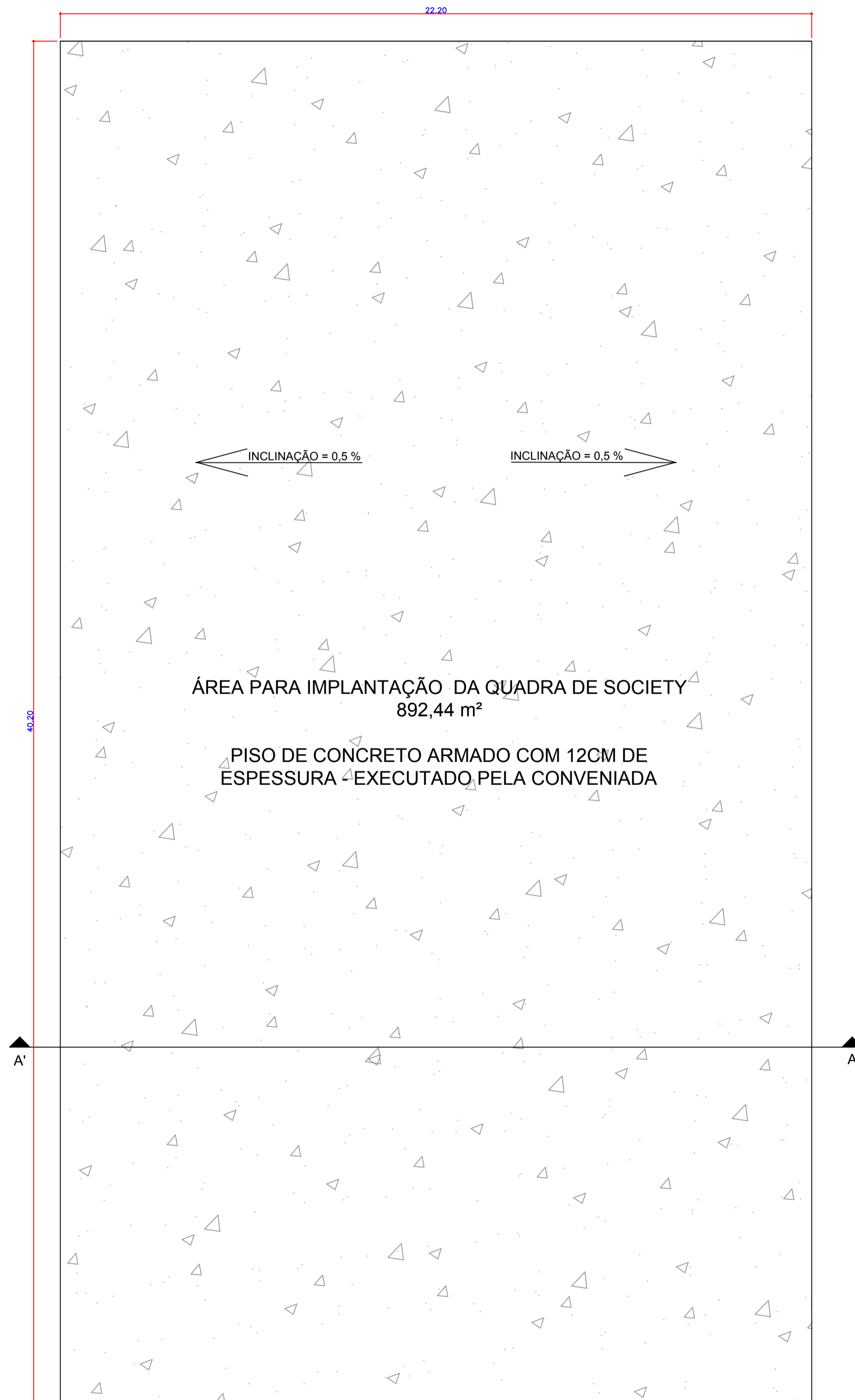
PLANTA BAIXA - IMPLANTAÇÃO PISO DE CONCRETO QUADRA SOCIETY esc. 1:100

4. EXECUTAR A DRENAGEM DE ÁGUAS PLUVIAIS NO ENTORNO DA ÁREA DE IMPLANTAÇÃO DA MINI ARENA ESPORTIVA.