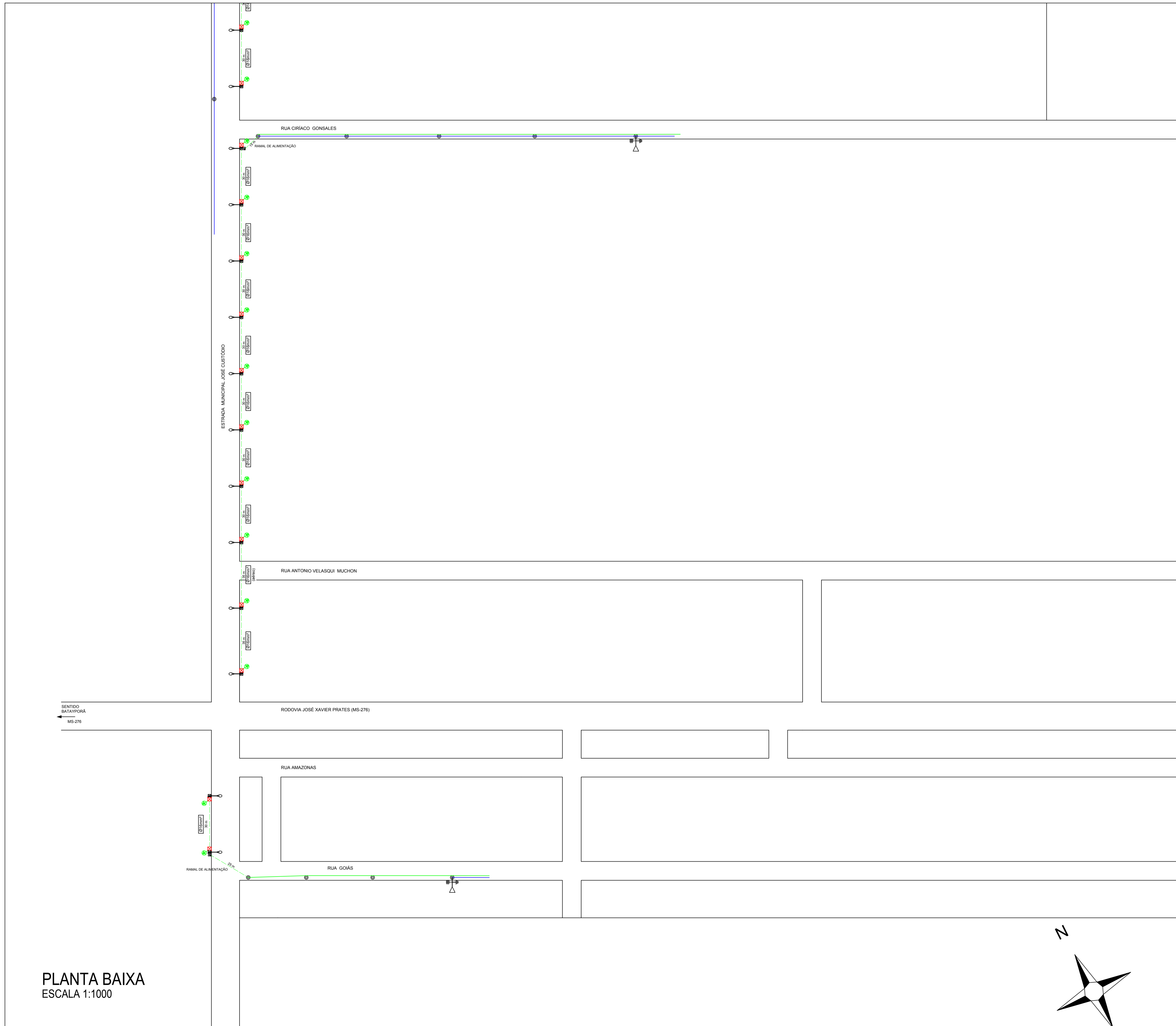
PLANTA BAIXA ESCALA 1:1000