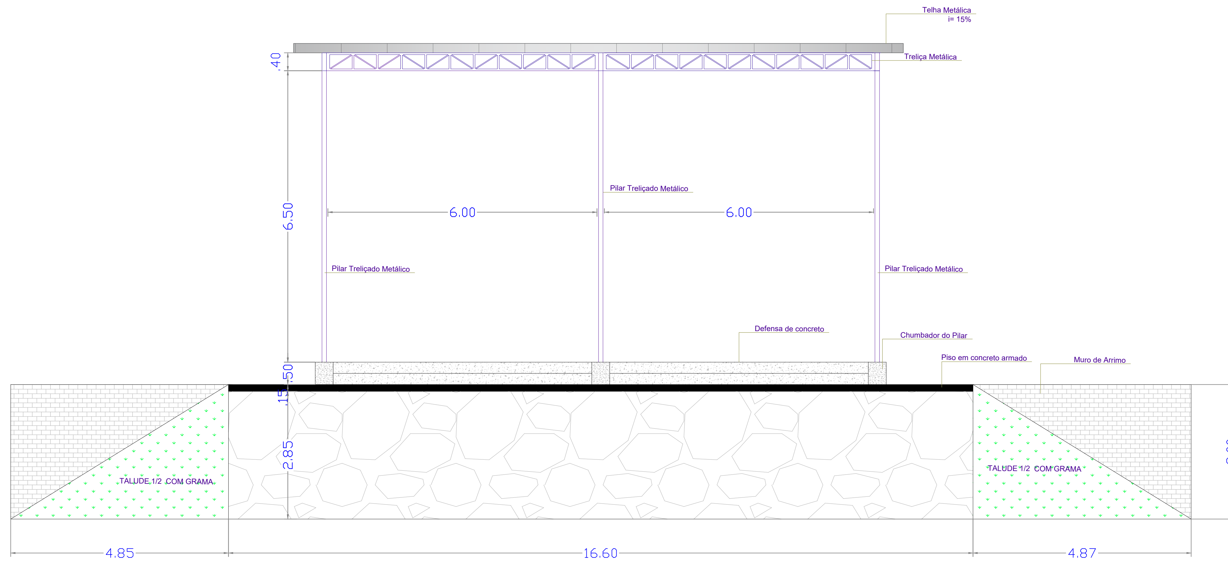
Vista Frontal ESC.:1/50