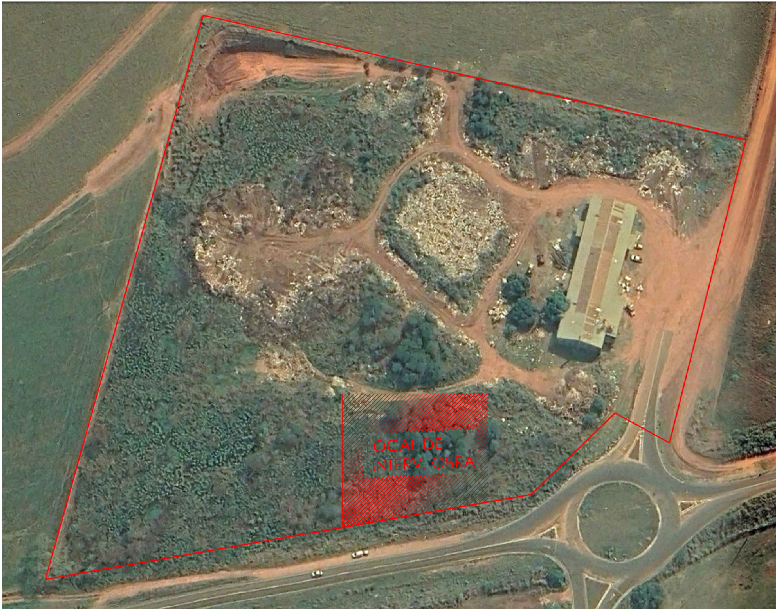
Imagem de Satélite Google Earth Escala 1:1000