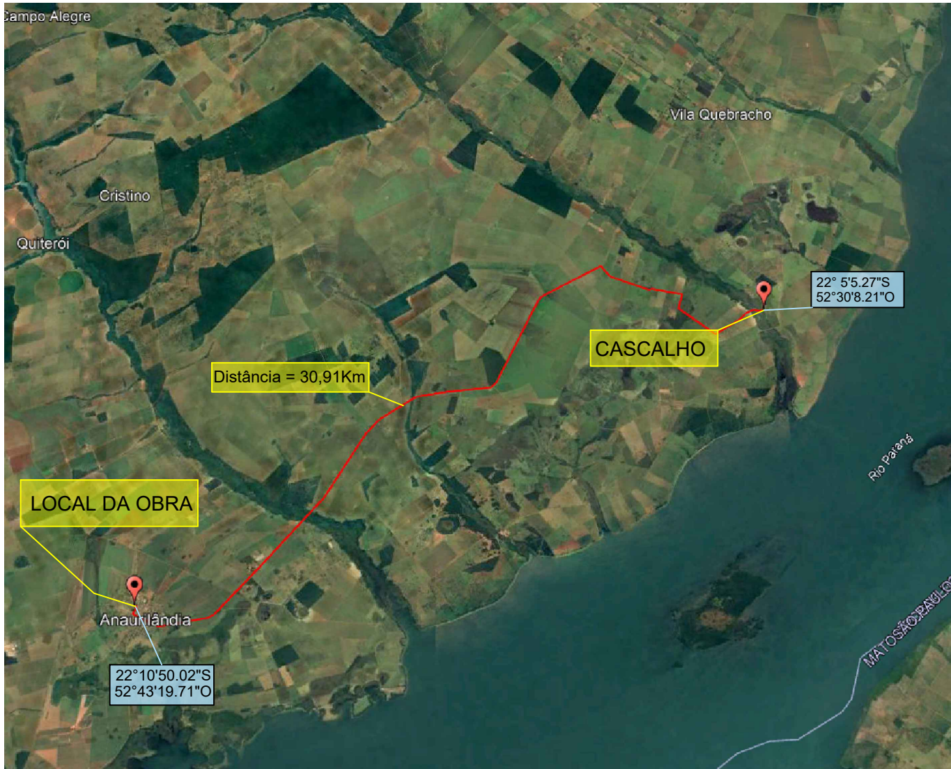
Jazida de Cascalho