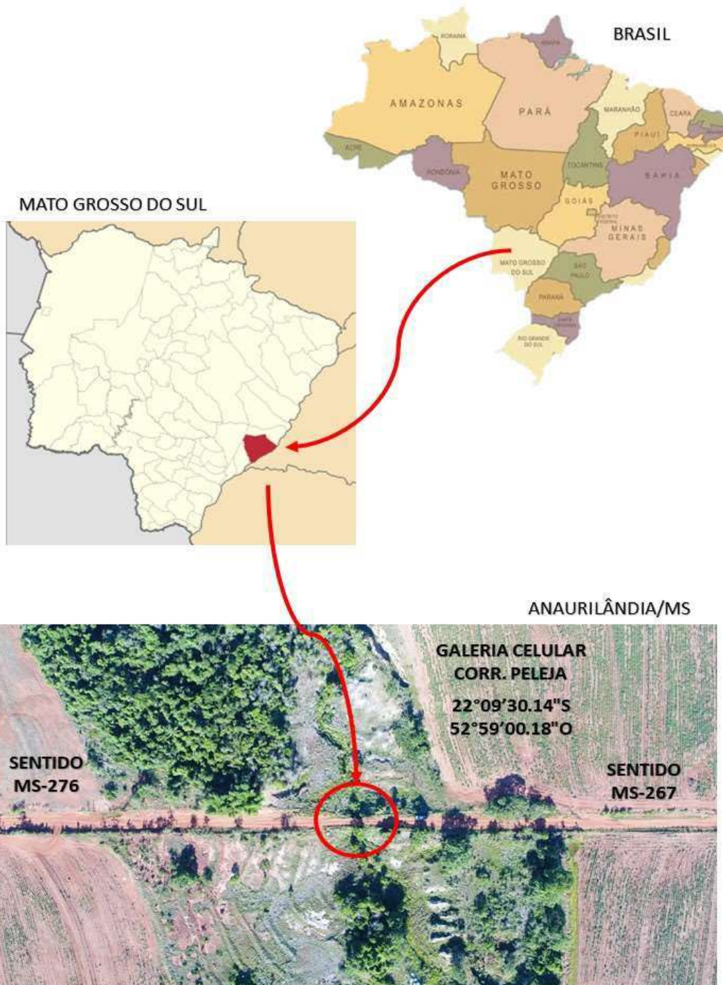
Figura – Mapa de Situação no Local do Bueiro